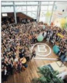
Lo sviluppo In Italia le B Corp sono cresciute del 26% rispetto al 2020 e ora sono 140 nei più svariati settori

on line entrando nel sito bimpactassessment.net e rispondendo a 200 domande scopre se il suo punteggio la autorizza ad essere certificata "promossa", a quel punto comunica il risultato e viene verificato che sia tutto in regola». Non basta. «Non solo queste realtà modificano i loro statuti adeguandoli alle realtà benefit ma hanno sempre più chiaro che il loro non è un lavoro "solitario" quanto un processo di collaborazioni e con uno spirito