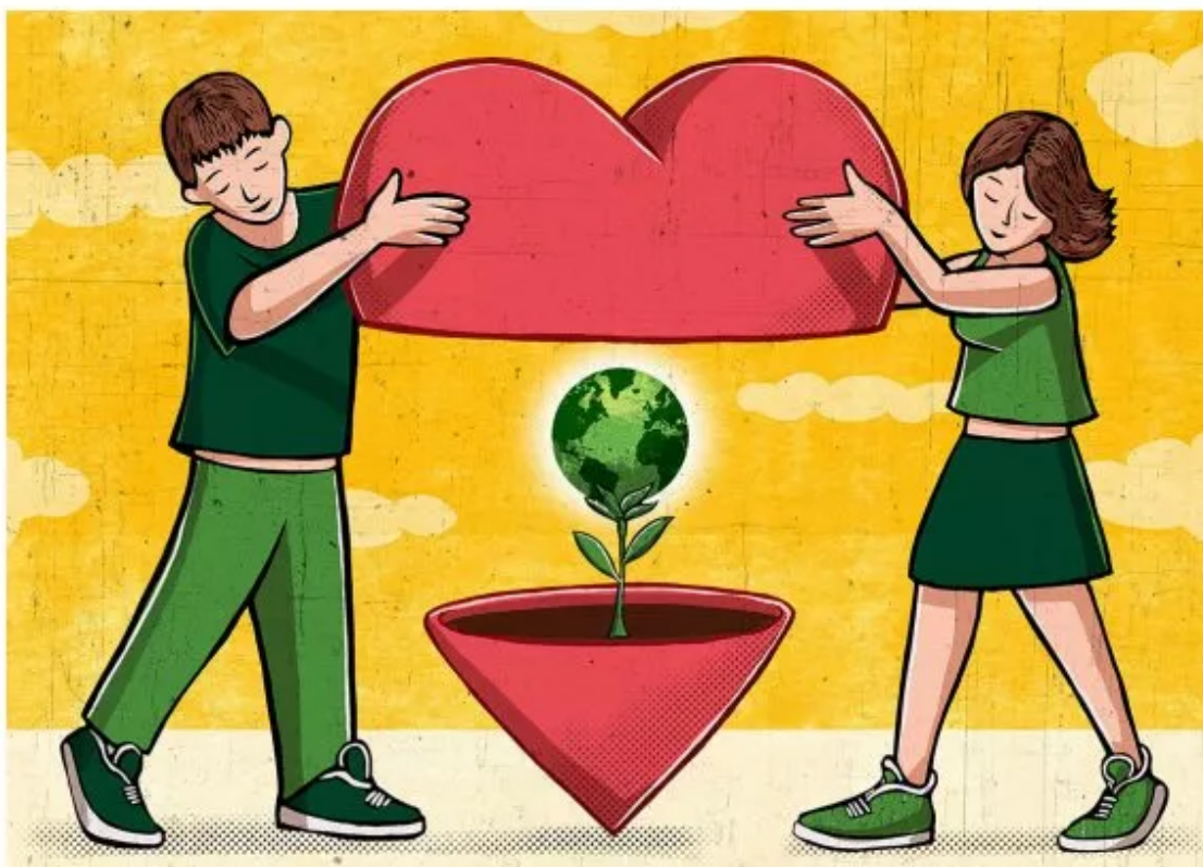
Illustrazione di Alberto Ruggieri

Largo ai giovani e a chi li aiuta a crescere di Alessandro Gassmann